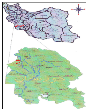
شکل ۱- نقشه موقعیت استان خوزستان و منطقه مورد مطالعه، نسبت به کل کشور

منطقه مورد مطالعه تحت عنوان حوضه آبخیز معرف و زوجی با وسعتی برابر ۵۹۷/۵۷ هکتار، بین طولهای ۲۹°، ۰۵'، ۴۸° تا ۰۹'، ۰۷'، ۴۸° درجه شرقی و عرضهای ۵۷'، ۱۲'، ۳۲° تا ۴۳'، ۱۳'، ۳۲° درجه شمالی، در ۳۵ کیلومتری شهرستان شوش (بخش غرب کرخه)، قرار دارد (شکل ۱). این حوضه دارای اقلیم مدیترانه‌ای است و به علت مساحت زیاد حوضه و پستی و بلندی‌های موجود، زیر اقلیم‌های متفاوتی در این حوضه وجود دارد. این منطقه دارای تابستانهای گرم، زمستانهای معتدل با متوسط متوسط ارتفاع دشت از سطح دریا ۱۶۰ متر، متوسط بارندگی سالیانه ۲۹۰/۶ میلیمتر، تبخیر از سطح آزاد ۲۰۷۸/۷ میلیمتر، درجه حرارت ۲۴/۶ درجه سانتیگراد، رطوبت نسبی ۴۵/۵ درصد، سرعت باد ۲/۵ متر بر ثانیه و جهت باد غالب شرقی- غربی است.